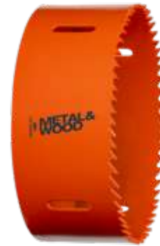
Corona bi-metal Sandflex® para planchas de metal/madera o plásticos, 25 mm, caja de cartón 3830-25-VIP