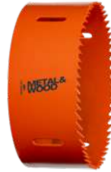
Corona bi-metal Sandflex® para planchas de metal/madera o plásticos, 19 mm, caja de cartón 3830-19-VIP