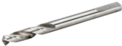
Broca piloto de acero rápido para soportes de corona, 6,35 mm x 81 mm 3834-DRL