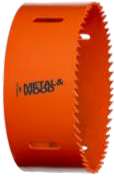
Corona bi-metal Sandflex® para planchas de metal/madera o plásticos, 64 mm, caja de cartón 3830-64-VIP