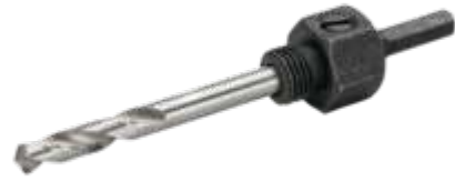
Soporte para coronas con vástago hexagonal para coronas de sierra pequeñas de entre 14 mm y 30 mm, 13 mm: 1 unidad/caja de cartón 3834-ARBR-1130